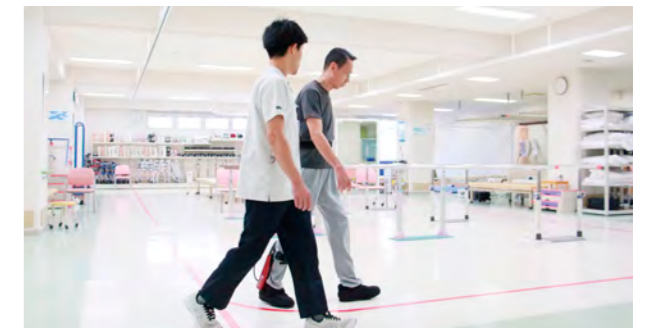
リハビリ訓練室での歩行訓練