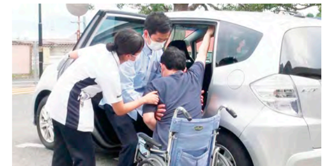
ご家族への介助指導