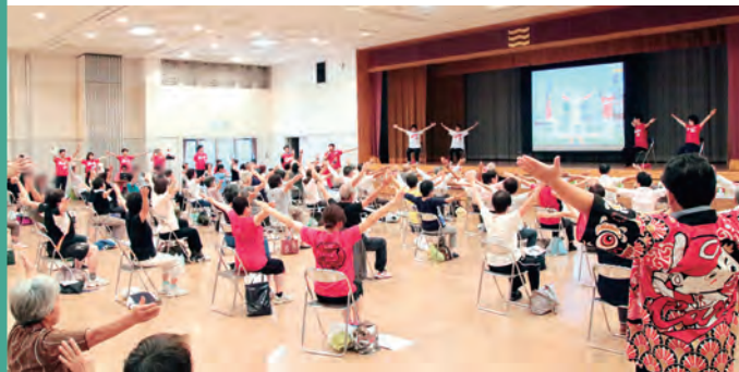
▲ スタッフは全員カーブのユニフォーム姿で、連帯感バッチリ!