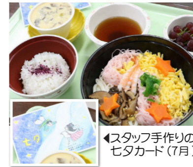
◀スタッフ手作りの七夕カード(7月)

当法人の行事食は、旬の食材を使い、栄養バランスやカロリーを計算し、調理してお出ししています。行事食には、季節感を味わっていただきたく、栄養課スタッフ手作りのカードをつけています。