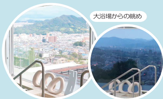
大浴場からの眺め

A. 当院では、入浴は基本的に週3回です。リハビリの疲れを癒したり、心身の健康を維持するため、リラックスして入浴できる環境の提供を大切にしています。